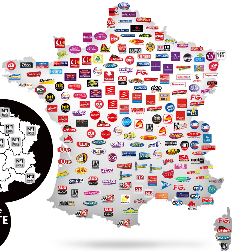
Couverture FM des Indés Radios - ICS LT 54 dbu