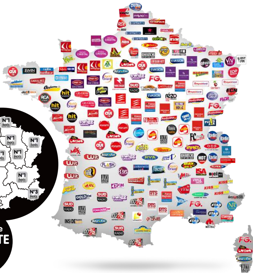
Couverture FM des Indés Radios - ICS LT 54 dbu